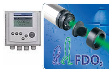
Optical DO WTW FDO