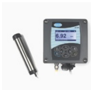
Optical DO HACH LDO